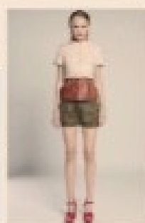
Alibaba ha investito finanziariamente nella collezione di 200 capi di alta qualità, da vestiti per le donne a giacche, camicie e accessori. Per la sfilata di ottobre il marchio punta sul segmento premium con i capi